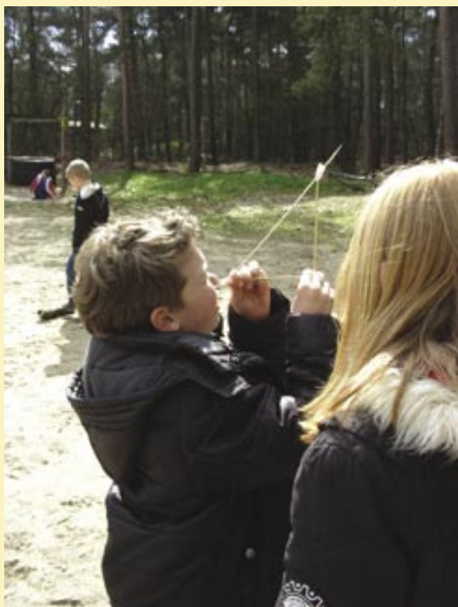
Rekenen in de praktijk: een boom opmeten.

“Elke dag kijk ik uit op de vijver. Ik kan me niet meer voorstellen hoe het daarvoor was. Het is lekker licht in de klas en het uitzicht op de vijver is voor de kinderen en mezelf altijd weer genieten. Bij het maken van de weektaak gaan er regelmatig leerlingen bij de vijver zitten werken. Vanuit mijn klaslokaal kan ik hen, net als de kinderen die binnen werken, goed volgen. Het feit dat ze buiten mogen werken is voor sommige kinderen net datgene wat ze nodig hebben om goed en geconcentreerd aan het werk te kunnen blijven”.