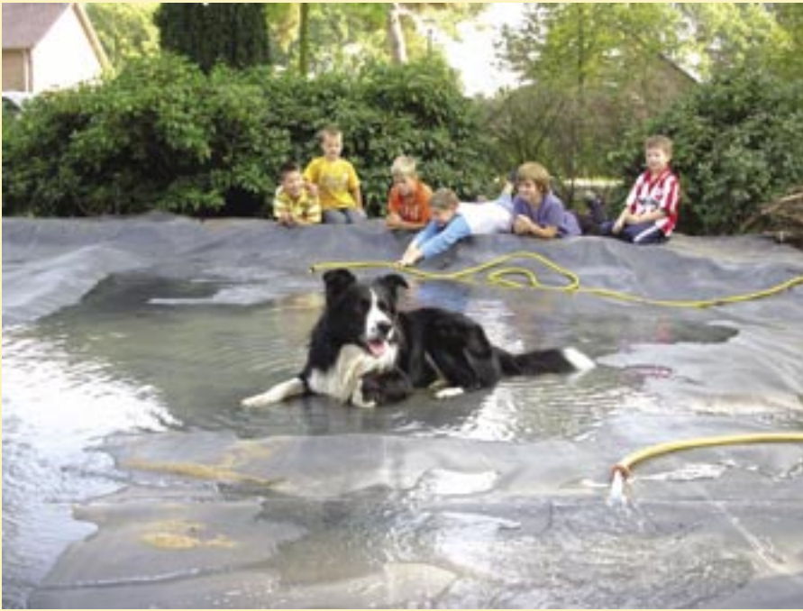
Iedereen werkt mee!

projectonderdelen, zoals een overkapping om ‘droog’ te kunnen werken, steken de buurt- en dorpsgenoten enthousiast de handen uit de mouwen. Hierbij doet iedereen wat hij of zij kan en wordt veel materiaal in natura bijgedragen. In 2009 werd er in één dag machinaal een vijver gegraven, een beregeningsinstallatie met waterpomp aangelegd, een composthoek gevlochten en planten verplaatst. Schapenhekjes scheiden de kleutertuin af van de tuin voor de oudere groepen.